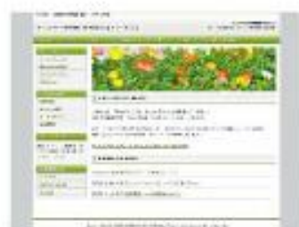
Value Garden Green