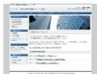
Value Biz Blue