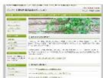
Value Leaf Green