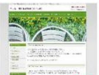
Stylish dot garden Green NEW