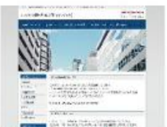
Stylish dot office Blue NEW