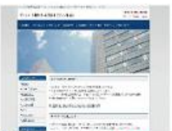
Stylish dot skbuild Blue NEW