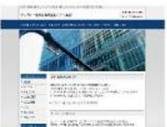
Stylish dot Blue NEW