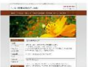
Stylish dot Brown NEW