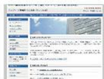
Value Build Blue