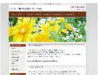
Stylish dot yellow Brown NEW