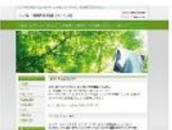
Stylish dot Green NEW