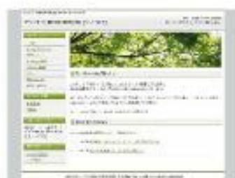
Value Maple Green