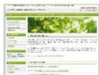
Value Forest Green