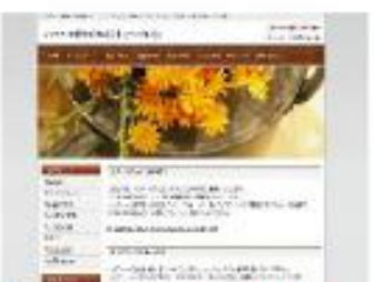
Stylish dot flower Brown NEW