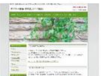
Stylish dot leaf Green NEW